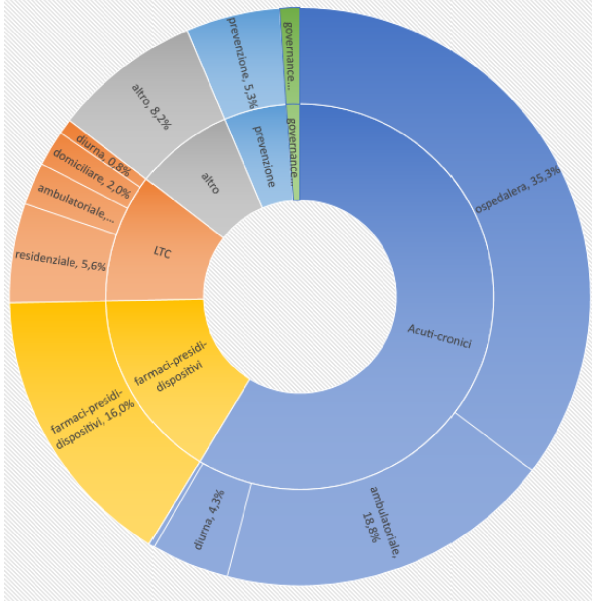
Fig. 1 -Composizione spesa sanitaria 2019 per funzione

Ns elaborazione su dati Istat, Sistema dei Conti della sanità