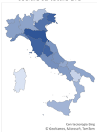
Associazioni di promozione sociale su totale ETS