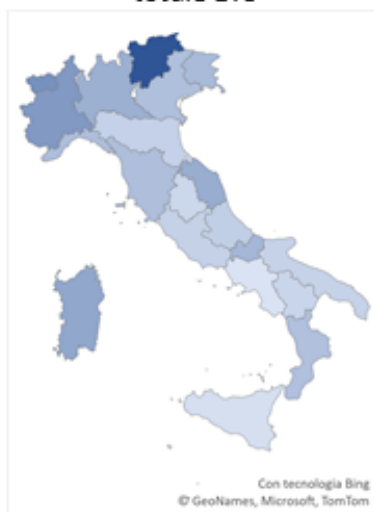
Organizzazioni di volontariato su totale ETS