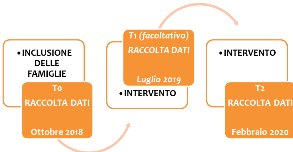
Figura 2. Il disegno della valutazione di P.I.P.P.I. (EEMM-famiglie)

Nei due periodi che intercorrono tra la prima e la seconda rilevazione (tra T0 e T1) e tra la seconda e l'ultima (tra T1 e T2), gli operatori attuano i dispositivi previsti sulla base delle azioni sperimentali definite nei momenti di rilevazione precedente (T0 e T1).