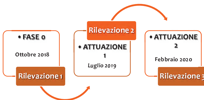
Figura 1. Il percorso di ricerca del programma P.I.P.P.I.

La possibilità di avere strumenti di conoscenza che documentino il rapporto tra il bisogno espresso dalla persona e la risposta fornita è utile per dare forma al lavoro sociale, al fine di renderlo verificabile, trasmissibile e comunicabile anche all'esterno.